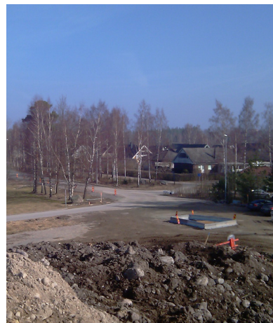
Vi bygger om Allmogevägen och ansluter den till gatorna i Vikaholm.