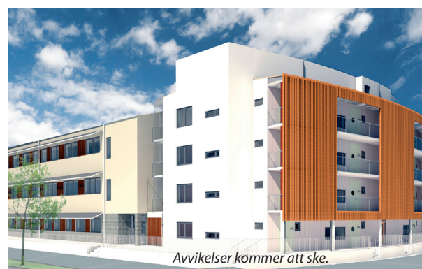
Avvikelse kommer att ske.

Skanska kommer även att bygga 190 bostäder på området, både hyres- och bostadsrätter samt studentlägenheter. Bygglov för hyresrätterna är inlämnat till Växjö kommun med en planerad byggstart under våren. Säljstart för bostadsrätterna planeras till hösten.